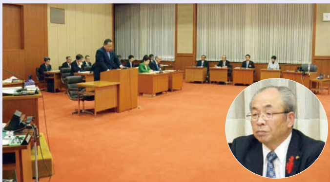
▲10/25 監査委員として決算委員会に出席

て仕事量が大幅に増え、限りある人員の中で県民生活を維持向上させるため頑張っている現状を目の当たりにしています。